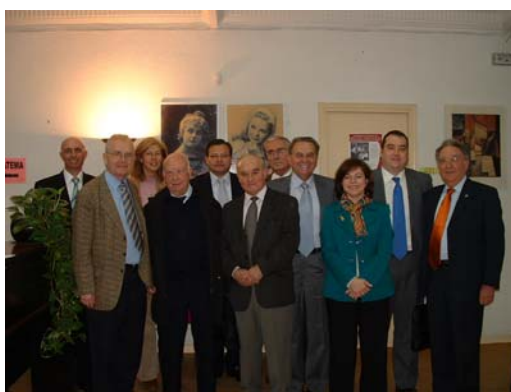
Miembros del Comité Científico y de Calidad

De jornada histórica para la Fundación de Geriatria y Gerontología cabe calificar la del 30 de Marzo pasado. Ese día en la sede de la Fundación se constituyó y comenzó su andadura el Comité Científico y de Calidad recientemente creado.